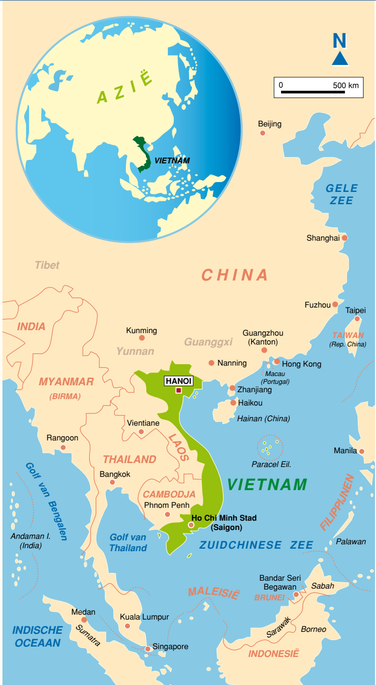
VIETNAM, LIGGED IN ZUIDOOST-AZIË