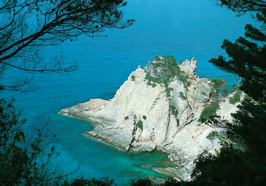
Schilderachtige kalkrotsen op de Punta de s'Aguila.

sage van de route. Machtige rotsbrokken liggen verloren langs het pad. Tussen de dennentoppen door vangt u zo nu en dan een glimp van de turquoise Cala Corp Mari op. Bijzonder pittoresk contrasteren daar de witte kalkrotsen op de Punta de s'Aguila mee, die associaties met Caspar David Friedrichs schilderij "Krijtrotsen op Rügen" opwekken.