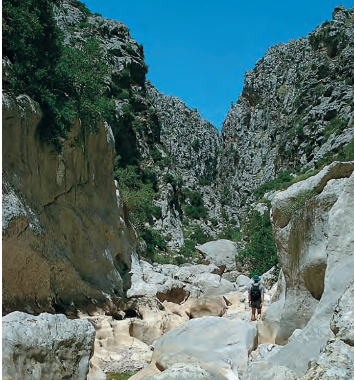
Door stortwater uitgehold kalkgesteente in de Torrent de Pareis.

een eerste rotsuitsprong heen. Op de steile wanden langs de erosiepoel, die in het begin van de zomer voor een deel nog met water gevuld zijn, kan de waterstand in de kloof worden afgelezen, die 's winters tot 2 m hoog kan zijn.